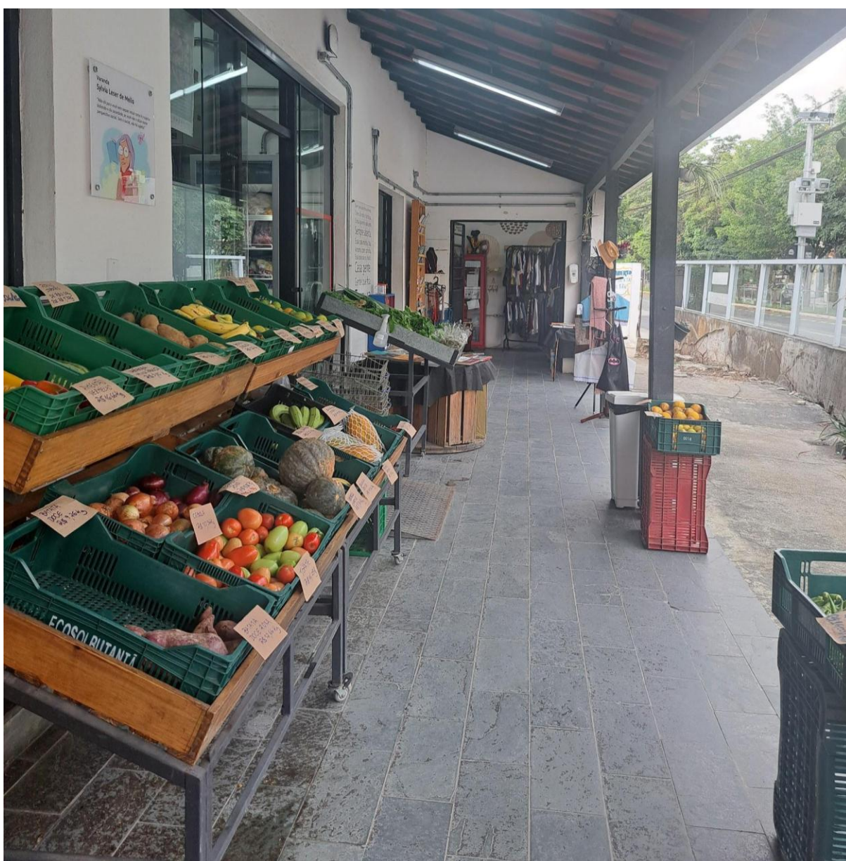
Figura 4: Varanda do Ponto.