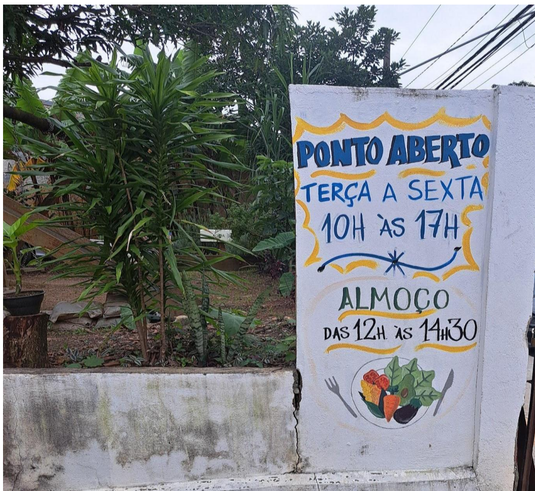
Figura 2: Mural de entrada (após renovação de grafite). 2024.

A comedoria Quiririm é o empreendimento que mais tem sobras financeiras entre os empreendimentos do Ponto. Como há uma circulação de pessoas pela região, seja por trabalho ou estudo próximo, muitas pessoas optam por almoçar ali ao longo dos dias da semana. Em relato obtido em julho de 2024, verificou-se que as trabalhadoras da comedoria, na época, chegavam a receber pouco mais de um salário mínimo, com rateio do transporte e almoço incluso na comedoria, ao fim de cada expediente. Abaixo imagem da entrada do Ponto: