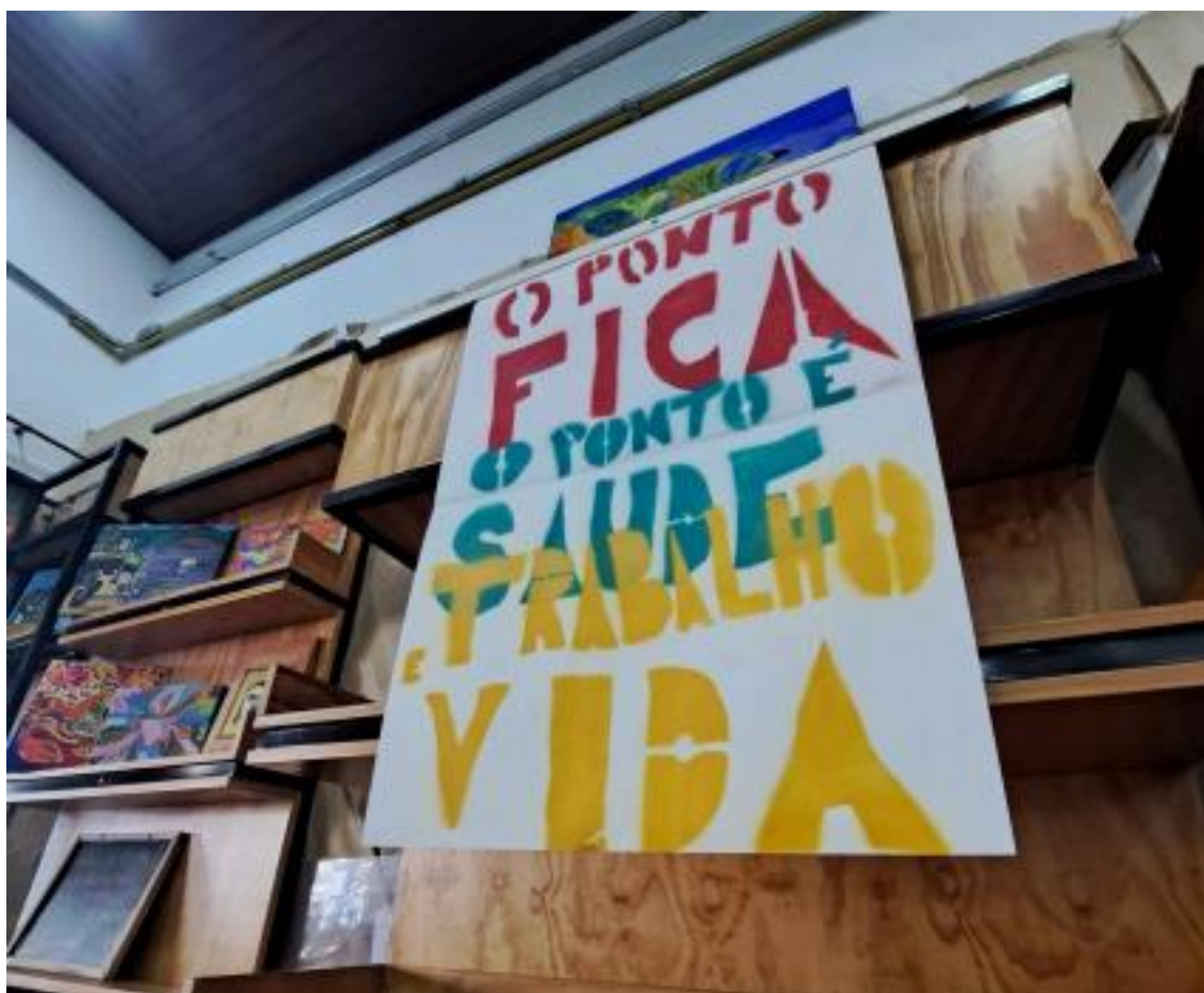
Figura 5: Bandeira “O Ponto Fica”, estendida no refeitório.

constante e articulação política com moradores do bairro, clientes e trabalhadores para defesa do espaço. Em 2022, essa pressão resultou em um grande movimento e mobilização social, que reuniu moradores da região, clientes do ponto, trabalhadores da Economia Solidária, a A Rede Butantã de Entidades e Forças Sociais além de políticos como Eduardo Suplicy, que realizou intervenções como chamamento de audiência pública e discorreu em favor da permanência do Ponto.